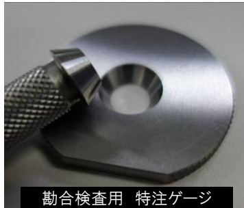
適合検査用 特注ゲージ