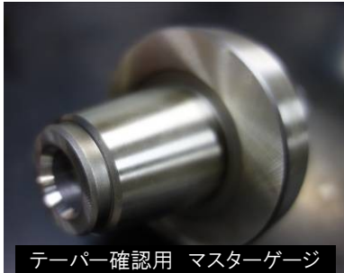
テーパー確認用 マスターゲージ