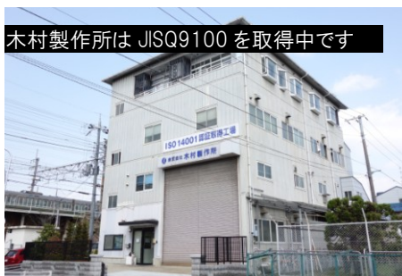
木村製作所は JISQ9100 を取得中です

木村製作所は木村製作所では、航空宇宙関連の品質マネジメント規格JISQ9100を年内に取得予定です。JISQ9100を取得している事業所数は日本国内でまだ300社程度。これまでも航空宇宙の仕事は数多く手掛けてきましたが、テクノロジーの最先端である航空宇宙分野のレベルに適合した水準で、すべての製品品質の確保を行い、また社内の技術・品質体制を向上するために取得を行います。今後も木村製作所をよろしく願ひ致します！